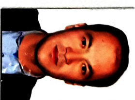
مړستیال/President حسن شفیقي

Waqf Construction Road Building and Construction Materials Production Company